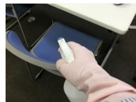
テーブル・椅子の除菌