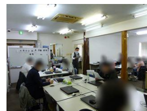
オリエンテーション風景

各項目ごとに質疑応答の時間を設け、わからないところを丁寧に解説し、終了となりました。