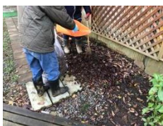
施設外実習の様子