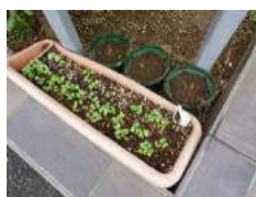
プランターの様子

ひゅーまにあで余っていたプランターに「二十日大根」の種を植えてみました。二十日大根とは別名”ラディッシュ”と言われ、スーパーなどではこちらで呼ばれて売られていることがあります。二十日大根は名前の通り二十日で収穫ができるのかと思いきや、一般的には一カ月から40日ほどかかるのです。ではなぜ”二十日大根”というのかという...気になる方は調べてみましょう。