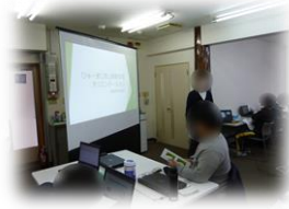
オリエンテーションの様子

新年度を迎え、新しい利用者さんも入られた為、オリエンテーションを開催しました。通所や訓練に関するルールの確認と今年度から新たに変更されたルールについて説明を行いました。日々の訓練の意味や、就労移行支援事業所とはどういった場所で、ひゅーまにあ上総ではどういった事が出来るのかなどをお話しました。