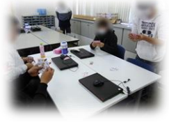
終了後はトランプを楽しむグループも...

3月の余暇支援は「人生ゲーム大会」を開催しました。グループに分かれ最終的に誰が一番多くのお金を持つことが出来るか競いました。ゲーム中は一攫千金を狙ったり、保険に入って手堅く進めていくなど、それぞれの性格を出しながら楽しんでいるようでした。終了後も、お互いにいくらお金をゲットできたか話し合う方も見られ、ゲームを通じて交流を深めているようでした。