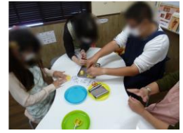
パン作り体験の様子

木更津市にあるパン工場「八天堂」へパン作り体験に行ってきました。工場内には見学スペースもあり、パンの製造ラインを見学する事もできました。見学後はパンの手作り体験をさせて頂きました。生地の形成から始まり、その後はチョコレートを使って大好きなキャラクターやイラストを描く方もいました。手作りしたパンはその場で焼いてもらい、焼き立ての美味しいパンを頂きました。