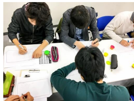
上 グループワークイメージ画像。

ちなみに・・・買い出し、予算、調理の手間も考えながら決まったのは、豆腐とアボカド、イカ(冷凍)、豚コマ入りの関西風お好み焼き、同じ材料で広島風にも挑戦！です。必要な調理器具も確認したので、役割を決めて準備を進めることになりそうです。