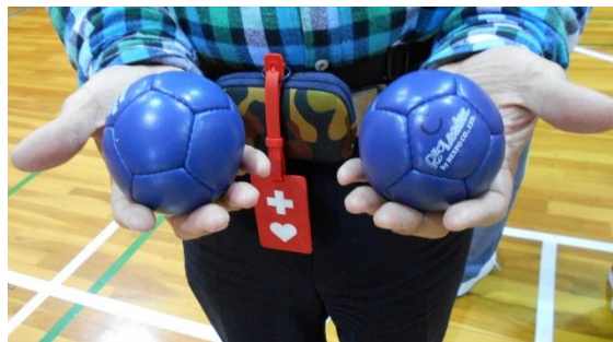
上 ポッチャの公式球。