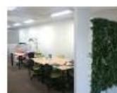
ひゅーまにあ福島