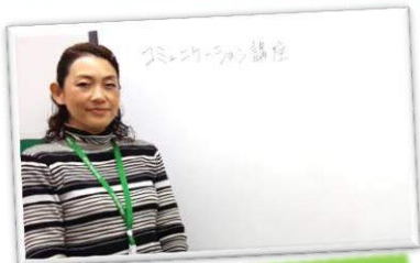
◎コミュニケーション講座

ひゅーまにあ千葉/千葉中央では就業時に必要なスキルや作業遂行能力の向上を目指し、様々な取り組みを行っています。また、ご自分のストレスや疲労の傾向を把握し、その対処方法を学び、トータルな視点から長期就業に備えています。