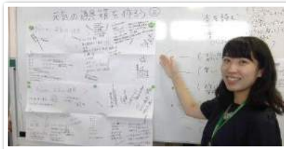
◎メンタルヘルス講座