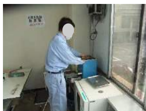
保護メガネの洗浄

職場のジョブコーチは、親会社出身の方々に社内に精通された方ばかり。作業指導はもちろん、安全教育にも力を入れています。職場の方は様々な障害をお持ちの方で構成されており、各自の強みを活かし、同僚の安全も確認しながら黙々と真剣に業務をされている姿が印象的でした。