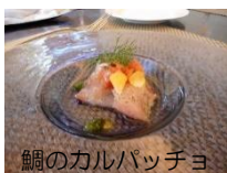
鯛のカルパッチョ