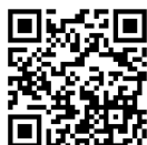
ひゅーまにあ上総HP