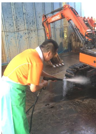
トラック・重機類の洗車、洗浄、塗装