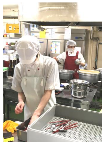
老人ホームの厨房、食器洗い、後片付け