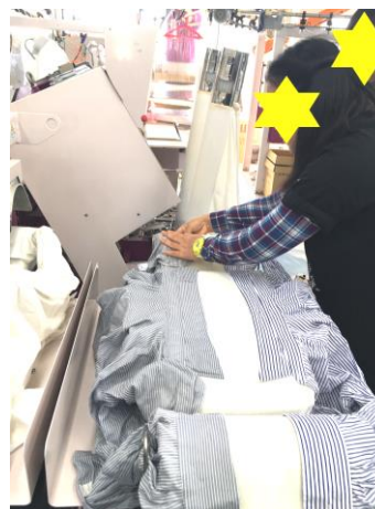
クリーニングセンターでのアイロンがけ