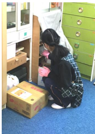
保育園の清掃、物品の整理・整頓

ひゅーまにあ鎌ヶ谷では利用者さんの職場実習を積極的に勧めています。施設や病院、一般企業、特例子会社など実習先は様々ですが、実習を終えると皆さん一様にたくましくなって戻っていらっしゃいます。なにしろ初めて会社や職場に入るので、ハラハラドキドキの連続です。その不安や緊張感を乗り越え、皆さん一歩一歩社会人に近づいて行きます。そのまま実習先の企業に採用が決まることもありますし、「良い経験ができた」ということで次の機会を待つ場合もあります。実習にはスタッフが同行しますが、企業側からも専門のスタッフがついて皆さんの様子を見ていただくことが多いようです。以下、実習の様子を写真で紹介します。