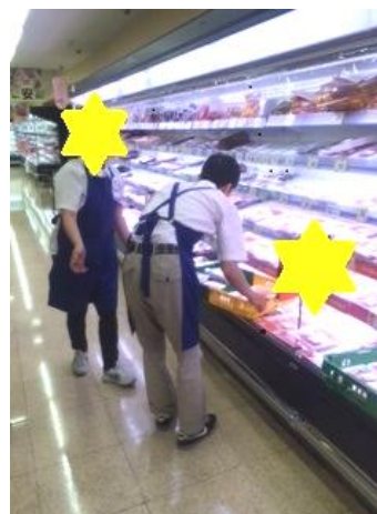
スーパーマーケットの品出し、商品の陳列