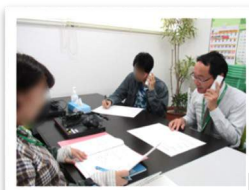
【少人数での電話対応訓練】

これまでさまざまな障害のあるの方にご利用いただいていた当施設のオススメしたいポイントがあります。障害の有無に問わず、長く働き続けるために必要なスキルをまとめた“職業準備性ピラミッド”を使ってご説明いたします。利用者さんお一人お一人にとことん支援していくことを念頭に置き、さまざまな訓練を提案しております。生活リズムの構築から一緒に始める方もいらっしゃいますよ。詳細につきましては、お気軽にお問合せください。