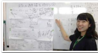
◎メンタルヘルス講座