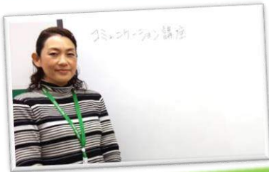
◎コミュニケーション講座

ひゅーまにあ千葉/千葉中央では就業時に必要なスキルや作業遂行能力の向上を目指し、様々な取り組みを行っています。また、ご自分のストレスや疲労の傾向を把握し、その対処方法を学び、トータルな視点から長期就業に備えています。