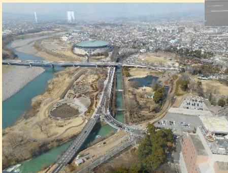
展望ホールから眺める、利根川と前橋公園