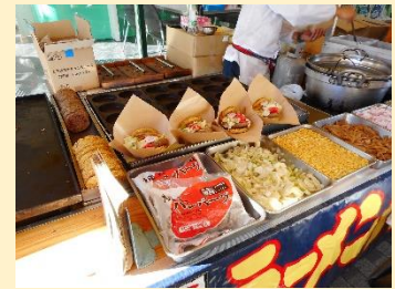
夕方から夜にかけて賑わう 前橋初市まつり (だるま市)