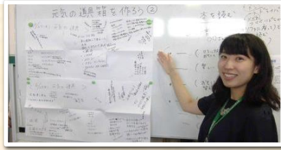
◎メンタルヘルス講座