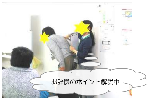
お辞儀のポイント解説中