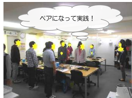
ペアになって実践！