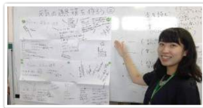
◎メンタルヘルス講座