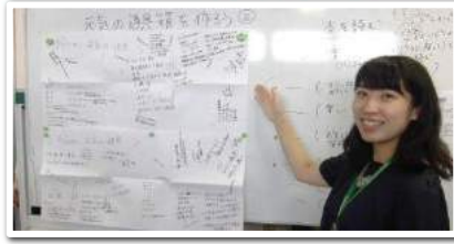
◎メンタルヘルス講座