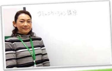
◎コミュニケーション講座

ひゅーまにあ千葉/千葉中央では就業時に必要なスキルや作業遂行能力の向上を目指し、様々な取り組みを行っています。また、ご自分のストレスや疲労の傾向を把握し、その対処方法を学び、トータルな視点から長期就業に備えています。