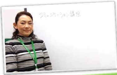
◎コミュニケーション講座

ひゅーまにあ千葉/千葉中央では就業時に必要なスキルや作業遂行能力の向上を目指し、様々な取り組みを行っています。また、ご自分のストレスや疲労の傾向を把握し、その対処方法を学び、トータルな視点から長期就業に備えています。