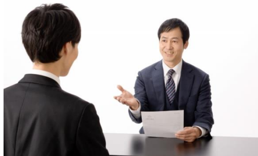
※上 画像はイメージです

先日面接練習を受けました。事前に聞かれるであろう質問事項を教えてください、準備をして臨んだのですが、いざ面接を始めるととても緊張しました。緊張のあまりどもったり、言いたいことを忘れてしまったりと反省点は多いですが、頂いたフィードバックと合わせて今後につなげられるという点で有意義でした。本番の面接を受ける前に機会があればもう一度面接練習を受けたいと思いました。