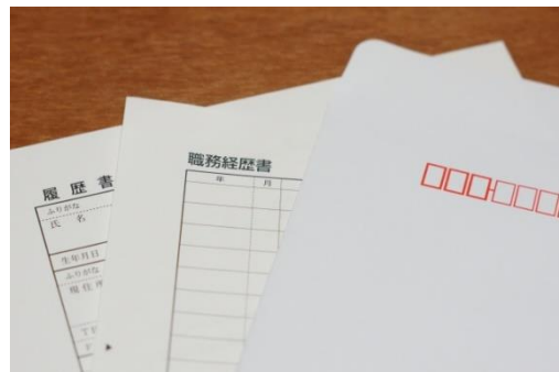
※上 画像はイメージです