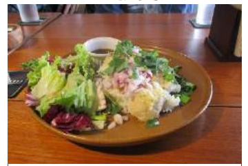
和風カオマンガイ

ホテル「ON THE MARKS 川崎」でのランチは、カレーやオムライスなどのおなじみのメニューも、ビールなどを使った味付けで、とてもおいしくいただきました。そのほか和風カオマンガイなどのメニューを各自楽しみました。