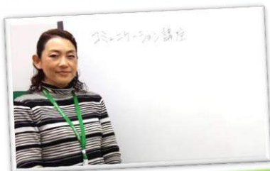
◎コミュニケーション講座

ひゅーまにあ千葉/千葉中央では就業時に必要なスキルや作業遂行能力の向上を目指し、様々な取り組みを行っています。また、ご自分のストレスや疲労の傾向を把握し、その対処方法を学び、トータルな視点から長期就業に備えています。