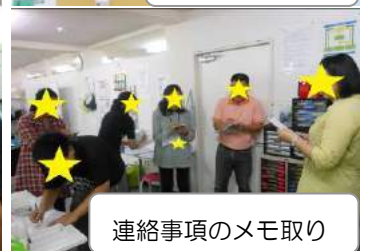
連絡事項のメモ取り