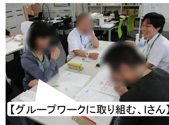
【グループワークに取り組む、Iさん】

お金をもらえるのは大きいですが、個人的には生活サイクルが整う。また、休みが楽しみになった。それが、働くっていいなと思う理由に繋がっている。