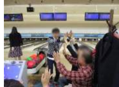
12/1 ひゅーまにあカップ ボーリング大会