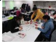
12/15 クラブ活動 美術・ジグソーパズル